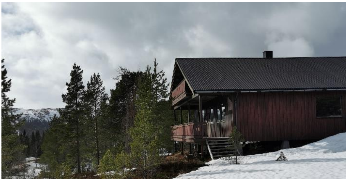
FIGUR 24 SKIHYTTA TIL OSEN-STEINSDALEN IDRETTLAG.

I dag har fritid og friluftsliv en sentral plass i folks hverdag. Ungdomshusene har vært viktige møteplasser på tvers av generasjoner i de ulike grendene over flere tiår. Et av de eldste er ungdomshuset på Haugen, som ble bygget på 1950-tallet. Det var tidligere ungdomshus i de fleste grendene i kommunen. Til tross for at bruken av ungdomshusene har endret seg de siste årene, har de fortsatt en betydning i de ulike grendene.