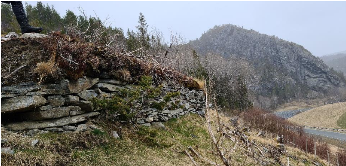
FIGUR 14 RIVEN, NORDMELAN.

Selv om det meste av ferdsel tradisjonelt har foregått med båter langs kysten, fantes det også tidlig veier for både mennesker og buskap. Veiene endret seg både til ulike årstider med også som følge av endring i bosetningsmønster. Veiene har en historisk referanse til både hvordan folk bodde og hvordan samfunnet har endret seg. De eldste sporene etter ferdsel som fortsatt er synlige i dag, for eksempelvis gjennom merkesteiner og varder. Disse ble brukt for å markere hvor man skulle gå.