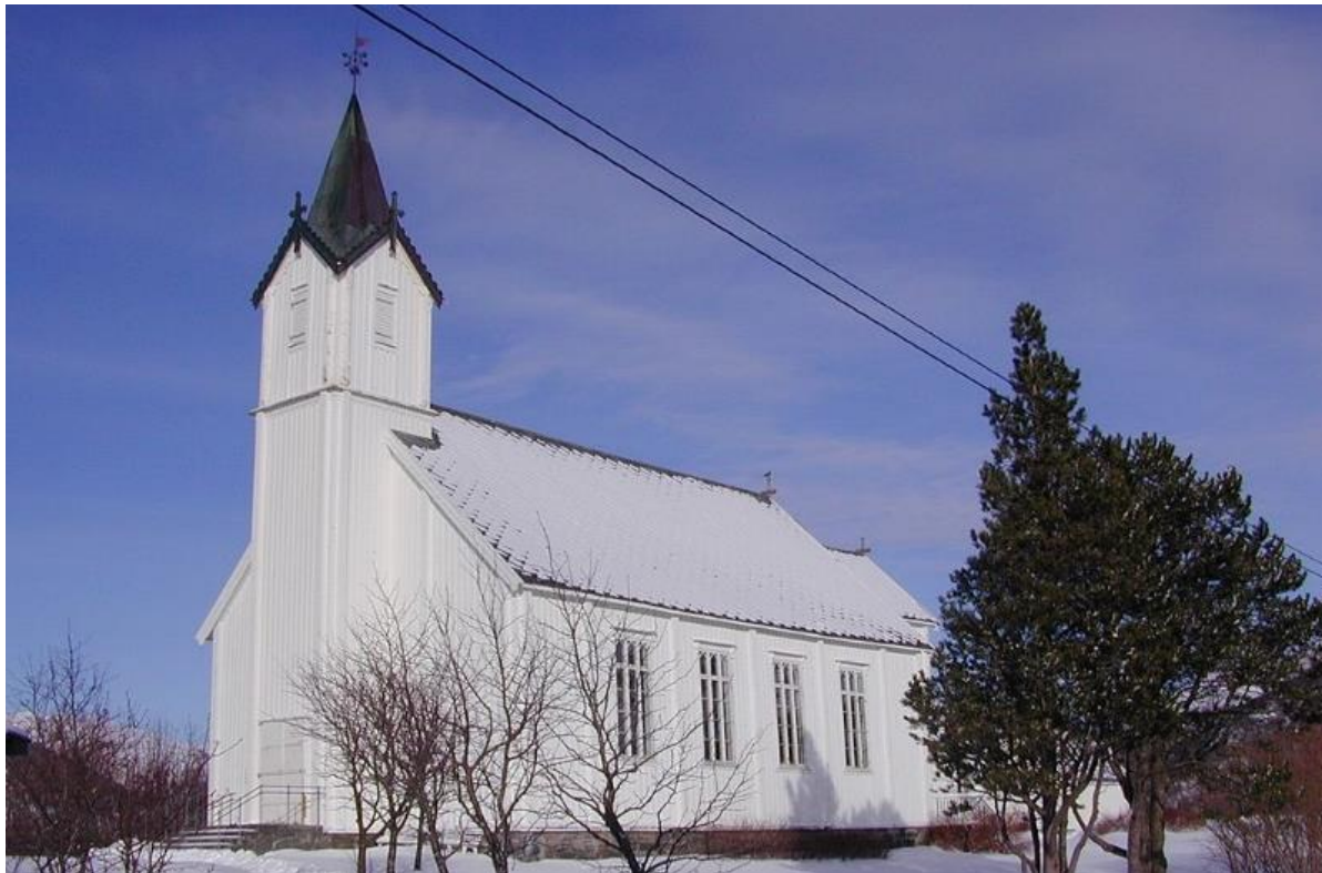
FIGUR 22 OSEN KIRKE.

Den eldste kjente kirka i Osen er trolig fra 1589, men det mulig at det har vært kirke på stedet tidligere. Dagens kirke ble innviet 1878, og avløste ei mindre kirke som ble oppført i 1840 og som stod på omtrent samme sted som dagens bårhus. En del av det eldre inventaret i kirka er bevart, som blant annet messingfatet i døpefonten.