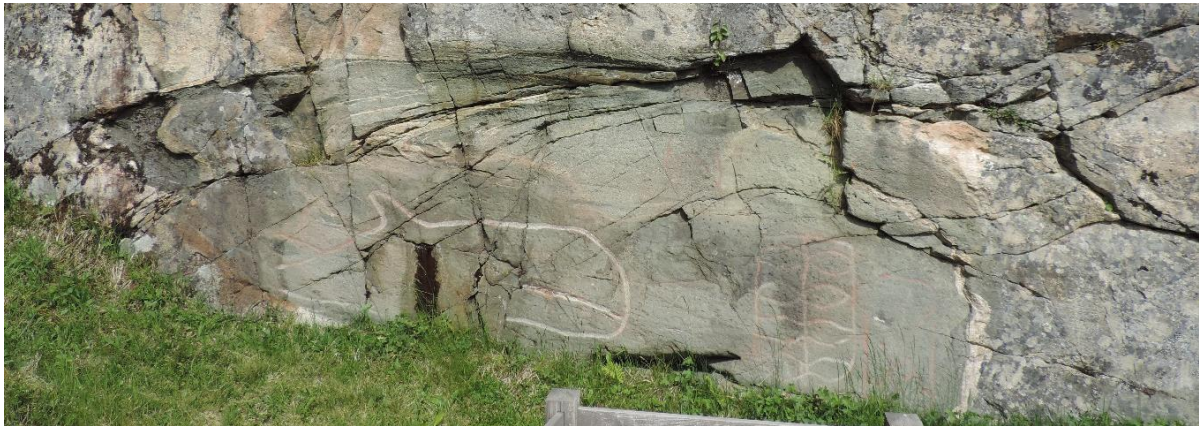
FIGUR 2 HELLERISTNING, STRAND.

Osen har et rikt kulturlandskap fra fjell til kyst. De første sporene som er bevart etter mennesker i Osen, dateres til steinalderen. Et av de mest kjente kulturminnene i Osen fra steinalderen er de tilrettelagte helleristningene på Strand. Dette feltet består av 8 figurer, hvor den største figuren er en naturalistisk utformet grindhval som er 2,9 meter lang. I tillegg finnes blant annet to mindre dyrebilder og tre geometriske figurer. Figurene er hugget inn i berget ved hjelp av enkle steinredskaper en gang i yngre steinalder, trolig for 5.000 år siden.