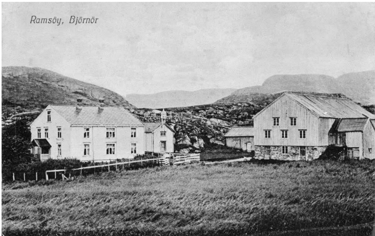
FIGUR 7 MØLLERGÅRDEN, RAMSØYA.

Før 1700-tallet var mye av Osens gårder eid av Reins kloster eller kongens eiendommer. På slutten av 1700-tallet ble gårdene etter hvert overtatt av leilendinger. Mange kombinerte fiske og landbruk. Under 1. verdenskrig ble det pålegg om tvangsdyrking av jord for å bedre sjølforsyningen. I tillegg var det dårlige år for fisket i årene rundt 1920, og det gjorde at flere fiskerbønder i Osen gikk over til å være kun jordbrukere. På 1950-60 tallet var det en stor satsing på bygging av driftsbygninger. I denne perioden ble det bygd 30 nye fjøs i Osen. Da veien til Namdalseidet kom, ble melka levert til meieriet på Namdalseid. På 1990-tallet skjedde det strukturendringer i jordbruket i Osen. Enhetene i drift ble større, men færre. Antall bruk har gått ned mens produksjonen totalt har gått opp.