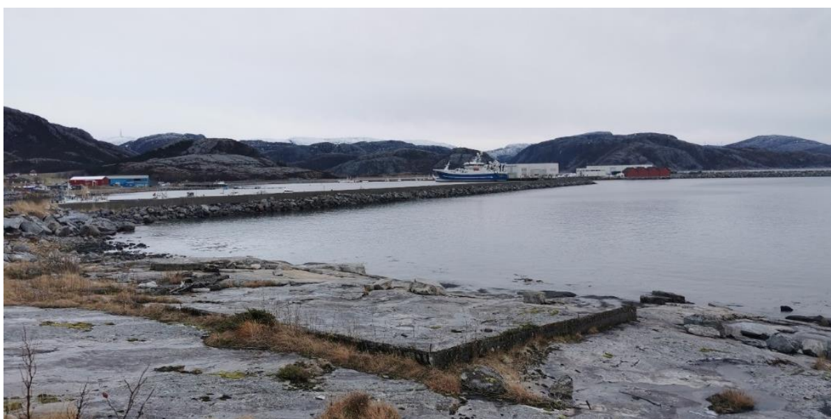
FIGUR 17 MURENE FRA DET FØRSTE NAUSTET PETER HEPSØ BYGGET.

Fisket har stått sentralt som nærings- og handelsgrunnlag, fra tidligere småskalafiske med mindre fartøy til større trålere. Fortsatt er fiske en viktig del av næringsgrunnlaget i Osen.