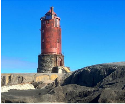
FIGUR 13 KYA FYR.