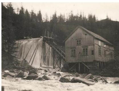
FIGUR 20 STEIN MØLLE.

Skogen med tømmerhogging var en fast arbeidsplass for mange, og mange reiste bort for skogsarbeid. All form for skogsarbeid ble før i tiden utført med håndkraft. I den tida brukte de svansen, øksa og barkespaden som verktøy og hesten som trekraft. Det var en fordel å ha hogst i nærheten av kysten, her var det mildere og mindre snø. Tømret skulle fløytes til havet og man var avhengig av god vannføring og store nedbørsmengder. På høsten var det store nedbørsmengder og elveflom. Da ble tømmeret fraktet ned elven, samlet i lenser og fraktet videre til nærmeste sagbruk. I Osen ble det etablert flere sager som tok imot tømmer fra skogbruket. Allerede i 1915 ble det reist ei sirkelsag i Skipelva. Den var i drift frem til 1965. Fossefallet der blir fortsatt kalt Sagfossen.