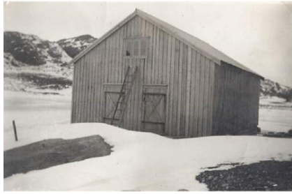
FIGUR 18 ISLAGER, VINGSANDVATNET.

Det var ulike behov som skulle dekkes, men ute ved kysten var det fiskeriene som drev fram utviklingen. Tilgangen på og bruken av is til kjøling var avgjørende for produktkvaliteten og utslag på pris på produkter. Isen var også viktig for å kunne oppbevare agn best mulig. Ferskest mulig agn var viktig for linefisket. Ishusene ble anlagt i nærheten av vann og kai. Isen ble saget i blokker og deretter lagt i ishuset. Islageret ved Vingsandvatnet ble bygd i 1941. I dag står bare murene igjen.