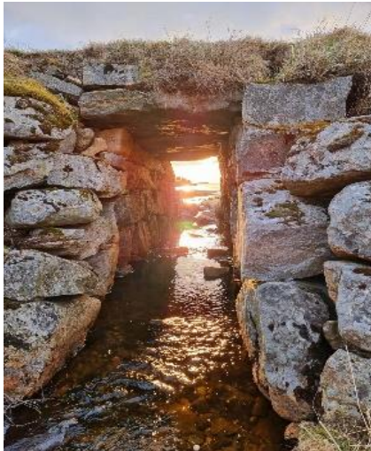
FIGUR 15 KULVERT, HØVIKA. FOTO: BENTE HOPEN

Det ble bygget flere veier etter krigen som en del av de nasjonale tiltakene for å sysselsette folk og bygge opp landet. I Osen ble det bygget flere slike veier, som blant annet veien mellom Ramsøya og Ramsaunet, mellom Hopen og Bjørsvika og veien ut til Estenvika.