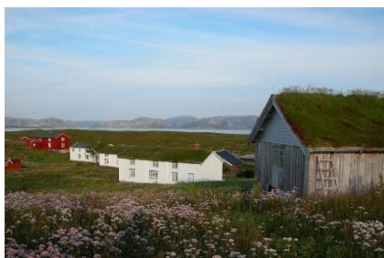
FIGUR 6 BUARØYA. FOTO: OLE BLENSLI

På Skjærvøya står Tindvikstuen, en gammel strandsitterstue. Strandsittere var personer i kystdistrikt som bodde ved sjøen og eide hus på leid tomt, altså kyst-husmenn uten jord. Det er også en strandsitterplass i Hopen (Jamtplassen) og Vingsand (Svørdern).