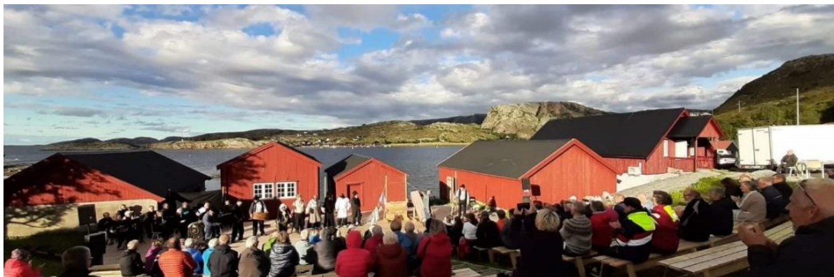
FIGUR 23 OSEN BYGDATUN. FOTO: ELI LOTHE

Osen Bygdatun eies av Osen kommune og ble etablert i 1972. Bygdetunet består av Vingsandgården, som er et komplett gårdstun fra 1800-tallet. Tunet inneholder hovedbygning, bur, masstu, driftsbygning, to brygger og to naust. I tillegg er det blitt tilflyttet en skole til bygdetunet. Det er også blitt reist et naust som har museets driftsfunksjoner og en utendørs arena for blant annet aktiviteter som konserter og teater. Bygdetunet har ca. 3.000 gjenstander og brukes i dag som historisk arena med fiskerbonden som tema.