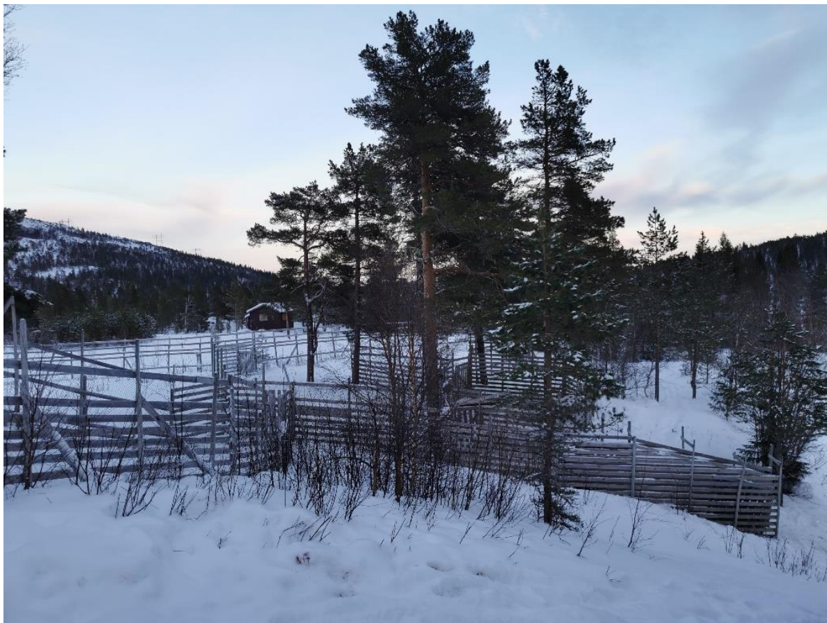
FIGUR 9 INNHEGNING FOR SAMLING AV REIN, NAMDALSEID.

Kulturminner forteller om samisk tilstedeværelse med vekt på fiske, jakt og fangst i eldre tid – og senere også reindrift, jordbruk og husdyrhold. Mange av de samiske kulturminnene er vanskelig å se i landskapet, da det tradisjonelle nomadiske levesettet setter fysiske avtrykk som med tiden går tilbake til naturen. Samtidig har det innenfor reindriften vært en kontinuitet i bruk av de tradisjonelle beiteområdene og samlingsplassene for rein, og noen av disse er fortsatt i bruk.