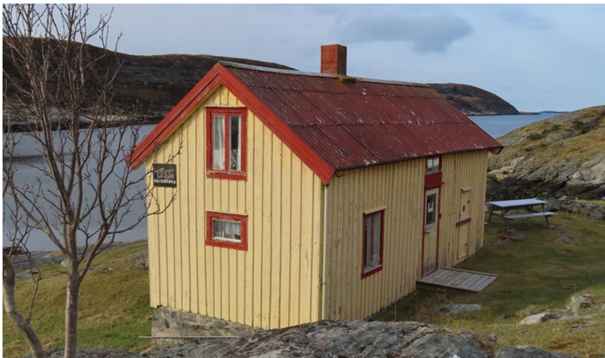
FIGUR 5 TINDVIKSTUA, SKJÆRVØYA.

På Skjærvøya står Tindvikstuen, en gammel strandsitterstue. Strandsittere var personer i kystdistrikt som bodde ved sjøen og eide hus på leid tomt, altså kyst-husmenn uten jord. Det er også en strandsitterplass i Hopen (Jamtplassen) og Vingsand (Svørdern).