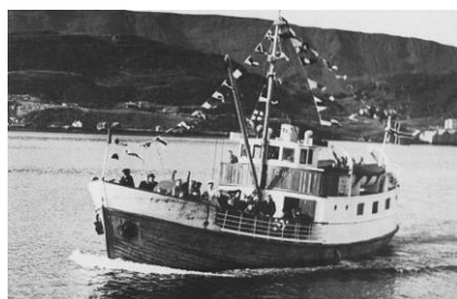
FIGUR 11 «NYVIGRA», RUTEBÅT.

Gjennom tidene har Osen-samfunnet tradisjonelt sett vært kystvendt. Havet var ferdselsveien innad i kommunen, men også ut til nabokommunene. De mange anløpsstedene for rutebåter og frakkebåter vitner om denne tilknytningen til havet som ferdselsvei. Anløpsstedene var datidens møteplasser, hvor både post, varer og nyheter ble utvekslet. Kaia på Sørkjerd var det gamle anløpsstedet for rutebåten mellom Osen og Roan. Da Fv715 ble utbedret, ble kaia fjernet. Et anløpssted som brukes til rutebåten enda i dag er på Sandviksberget. Bygningen som står igjen, er tidfestet til 1898 og er trolig Sandviksbergets eldste bygning.