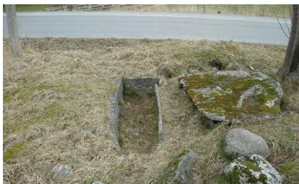
FIGUR 2 HELLEKISTEGRAV, STRAND.

Osen har et rikt kulturlandskap fra fjell til kyst. De første sporene som er bevart etter mennesker i Osen, dateres til steinalderen. Et av de mest kjente kulturminnene i Osen fra steinalderen er de tilrettelagte helleristningene på Strand. Dette feltet består av 8 figurer, hvor den største figuren er en naturalistisk utformet grindhval som er 2,9 meter lang. I tillegg finnes blant annet to mindre dyrebilder og tre geometriske figurer. Figurene er hugget inn i berget ved hjelp av enkle steinredskaper en gang i yngre steinalder, trolig for 5.000 år siden.