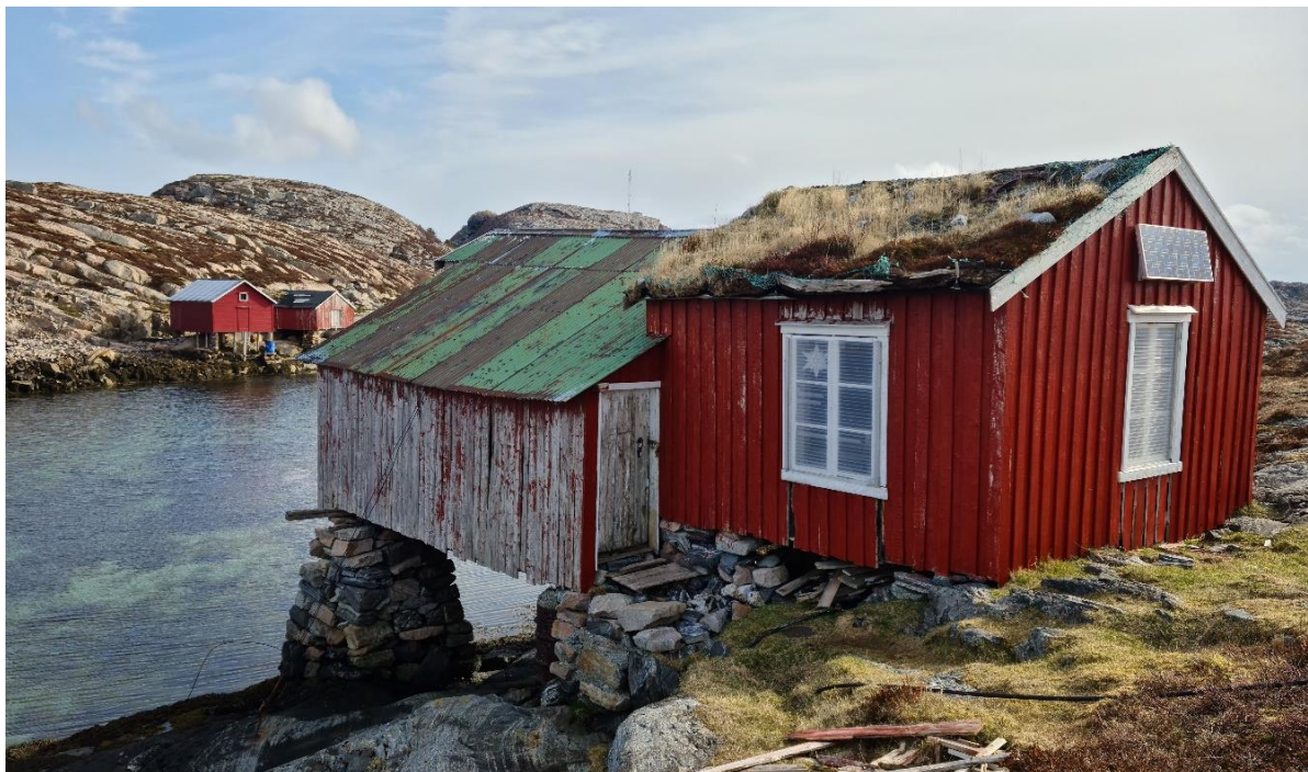
FIGUR 4 RORBUMILJØ, SKJÆRVØYA.

Havet og fiskeressurser har alltid betydd mye for bosetting og livsgrunnlaget for kystens befolkning. Historisk sett har kysten vært preget av fiskerbondens vekselbruk mellom sjø og jord. Fiskerbondens kulturminner er mange, og flere av disse er godt synlige i dag. Nesten alle øyene i Osen var bebodd på grunn av behov for nærhet til havet og fiskeressursene. I tillegg kom det folk fra indre strøk utover til øyene for å drive vinterfiske. Tilreisende fiskere bodde i egne rorbuer eller var innlosjert hos lokalbefolkningen.