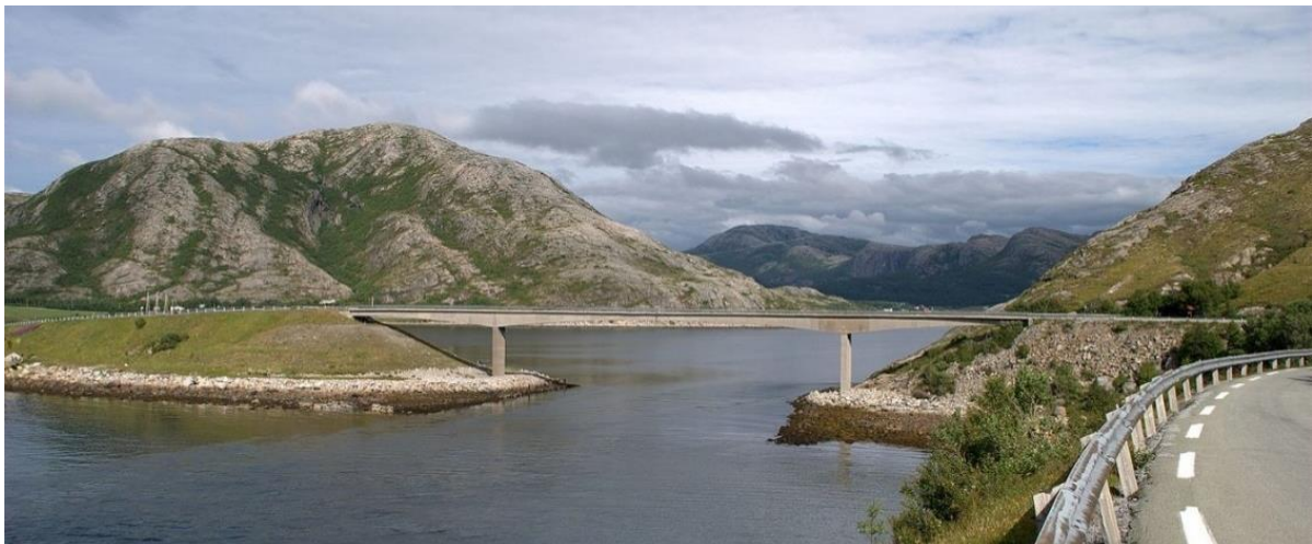
FIGUR 16 STRAUMHOLBRAU.

I dag er det flere veiforbindelser som binder Osen sammen med nabokommunene. De eldste av disse er kløvveien mellom Osen og Namdalseid. Bilveien over fjellet til Namdalseid stod først ferdig i 1960. I 2020 var en forbedret vei klar, lagt etter samme trasé bortsett fra ved Skarvåsen. Langs den gamle traséen finnes det også kulturminner fra etterkrigstiden. Det ble laget bunkerser langs veien og i berget på Skarvåsen ble det boret inn sprengningshull, slik at man kunne sprengte veien for å forhindre at eventuelle krigsfiender kunne benytte seg av den.