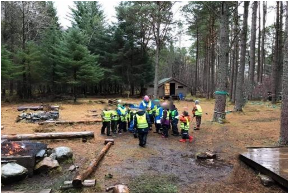
FIGUR 25 PERSKOGEN.

For svært mange har også idrettsanleggene hatt stor betydning, eksempelvis idrettsbaner, lysløype og skihytta i Steinsdalen. Idrettslagene har vært avgjørende i etableringen av disse anleggene. De har bidratt til etablering av møteplasser og skapt aktiviteter, særlig for barn og unge.