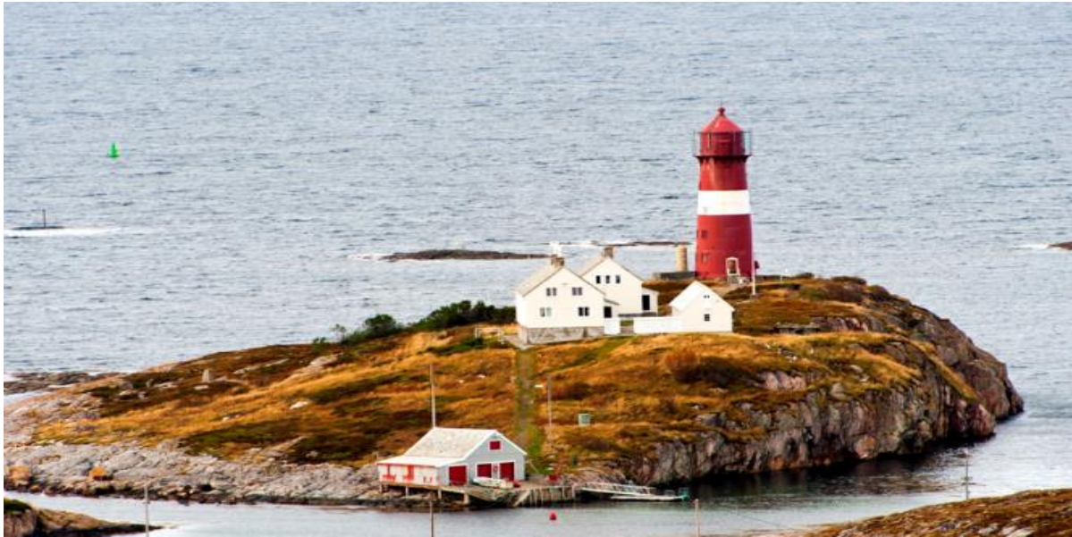
FIGUR 12 BUHOLMRÅSA FYR.

Fyrstasjonene i Norge forteller om en spesiell og svært viktig del av norsk historie. Satsingen på utbyggingen av fyrvesenet er en av de største i den norske stats historie, og utbyggingen av fyrstasjonene har bidratt til å utvikle Norge til en sjøfartsnasjon. Sammen med andre typer sjømerker danner fyrene et komplett system for sikker navigasjon langs kysten.