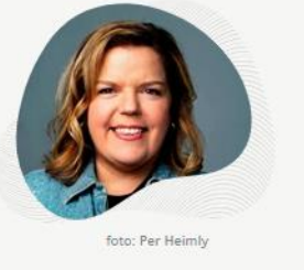
Else Kåss Furuseth